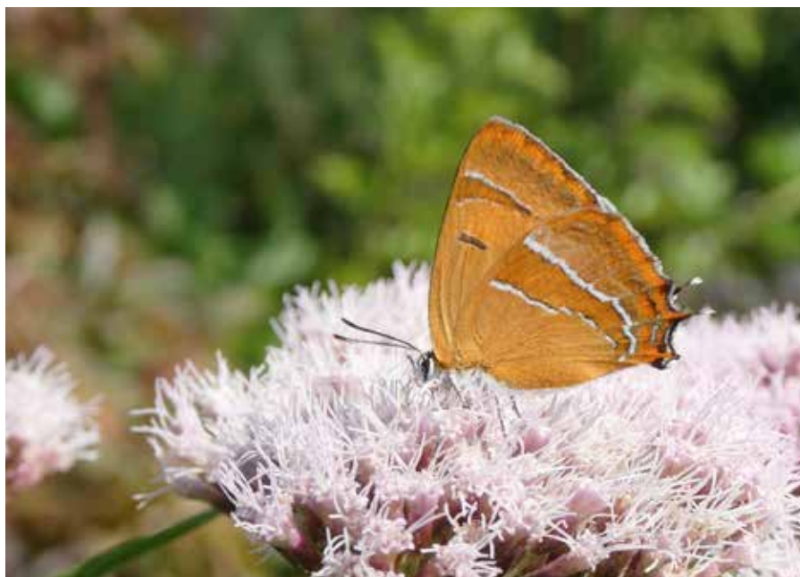
Sleedoornpage, vrouwtje op koninginnekruid