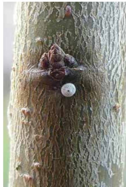
Eitjes: net kleine golfballetjes

hebben er zaagwerkzaamheden plaatsgevonden en kregen oude sleedoornstruiken weer licht, waardoor ze zich konden gaan verjongen.